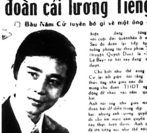
Kíp UT HIỂN với một hình ảnh chụp trong buổi diễn tập.

Đoàn "Tiếng Hát Dân Tộc" đã lên đường từ Saigon về quê nhà tại rạp Thanh Trì hôm nay đầu tiên để trình diễn trước hàng ngàn khán giả.