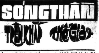
NAM THỦ TỬ □ SỐ 1041 □ THỨ TU 11-15-74