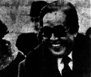
SATO TỐI NAY