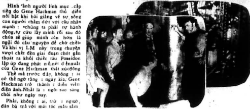
Nam tài tử nổi bật trong phim 'L'Aventure du Posséidon'

Được biết: tin nhà nước sang ở Đà lễ là cử chức họ đều xuất hiện tại trường... Exposition Coloniale Internationale de Vincennes... Các gánh hát... (còn nữa)