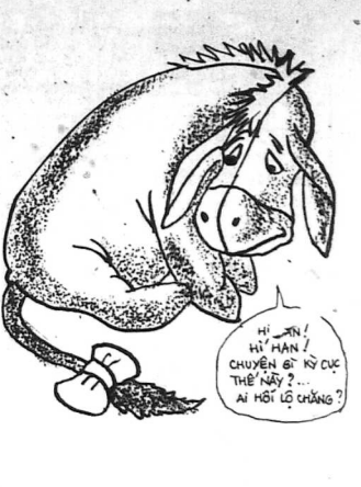
Truyện phỏng tác của HOANG HAI THUY