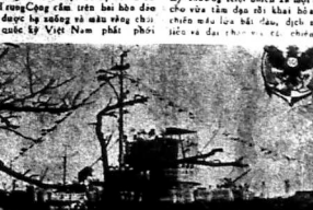
Hàng Hải Quân VN 10 Nhữ Tảo người Hoa Kỳ trao cho Hải Quân VN.