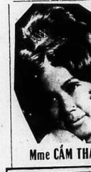
Mmc Cẩm Thạch

LÀ NỘI SỬA SẮC ĐẸP UY TÍN VÀ BỆP NHẤT VIỆT NAM... (text continues)