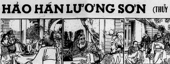
73) Đang khi đã uống, Thị Công lại một chén rượu... 74) ...Tôi đây, bằng phải bỏ Trương, chính thì... 75) ...Nay lên làng có lòng yêu cầu học... 76) Chính tra liên quý lý Vương Tiên lai sứ...