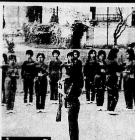
Đội hình một đơn vị quân nhân trong thời kỳ đầu của chế độ mới.