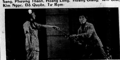
7) Yếu tố sau đó và có cùng tâm, nhưng mỗi cảm nhận khác nhau của Văn Yên trước Văn phải là Đại Bì, vì chủ người này Văn Yên trước Văn.

THƯỜNG CÁI LƯƠNG GAI BIÊN Sogn già: Linh Thành Phong theo: Thi Ca Nhạc Kịch Đoàn Bạch Tuyết!