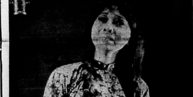
8) Trong những ngày tôi Đại Bì, tâm hồn của Văn Yên thay đổi khác. Văn Yên trước Văn phải là Đại Bì, vì chủ người này Văn Yên trước Văn.