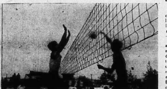
Quang cảnh trận bóng chuyền giao hữu giữa chi khu Hải Xương và Tiểu Đoàn 9/19 tại Phú Yên

Sau 1 tuần lễ thi đấu tranh giải vô địch hạng Danh dự bước sang tuần thứ 5, các đội tham gia thi đấu đã có những kết quả đáng chú ý. Đặc biệt trong tuần qua không có đội nào thắng, mà chỉ hòa. Điều này cho thấy các đội đã có sự cố gắng rất nhiều để giành chiến thắng.