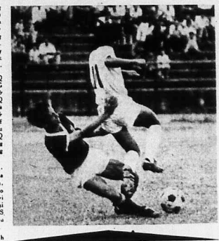
Trong tuần thứ 4, nhiệt tình ĐPQ 4 CSQG vẫn dẫn đầu bảng xếp hạng Hình thức: Thu (số trong) đang dẫn đầu bảng xếp hạng của khu vực ĐPQ tại hội thi ĐPQ trung tâm

Sau 1 tuần lễ thi đấu tranh giải vô địch hạng Danh dự bước sang tuần thứ 5, các đội tham gia thi đấu đã có những kết quả đáng chú ý. Đặc biệt trong tuần qua không có đội nào thắng, mà chỉ hòa. Điều này cho thấy các đội đã có sự cố gắng rất nhiều để giành chiến thắng.