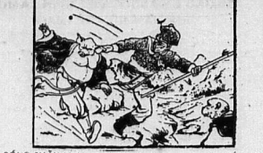
SÔNG THẦN hồ khuyê thiêu thì nư, cung cấp bộ TÂY ĐU KỶ đã nhốt cho bạn đọc Việt Nam yêu.