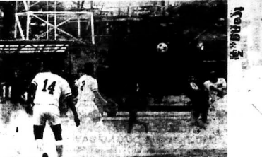
Một màn tranh bóng giữa các Trung Học Dân Quốc và Hội Trường Saigon trong giải đấu bóng bàn của đơn vị trường Công Học.