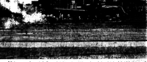
Những em học sinh Tam Kỳ lần đầu tiên cảm thấy thích thú khi được đến gần đàn gà một cách trực tiếp.

8 nông dân trúng giải thi An sinh xuất lộ gạo