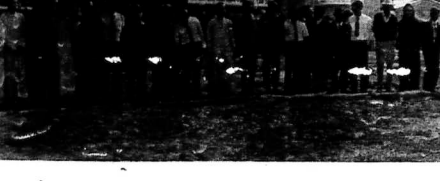
Đài diện các tôn giáo, đảng phái, chính trị hiệp hội, và chính quyền địa phương trong cuộc bình thưng thành phố 3 giờ tại Cam Ranh ngày 12-11-72.

Trường học bị hư hại trầm trọng ở Hon, 2000 con em lưu lạc (TIẾP THEO VÀ HẾT)