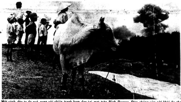
Một cảnh dân ta đi quê quen với chiến tranh hơn đơn tại một trận Bình Dương. Dân chúng vẫn rời khỏi ở quê không lực VNCH thành town. Cộng quân, còn dùng hình ảnh quê nhà khi lừa

SAIGON 16.10 Giao tranh tiếp diễn ở một số tỉnh bên ngoài vùng bị phong tỏa Saigon, tuy nhiên tình hình Bình Dương nay đã sáng tỏ sau khi QLVNCH tái chiếm một số địa phương bị Cộng quân nắm giữ. Phái viên ST Bình Dương cho biết Cộng quân đã bị đẩy ra khỏi vùng giải tỏa và phá tích của Bình Dương. Đây chỉ một công tác phá tích về Bình Dương quá không rõ ràng, hầu hết địa phương không gây thiệt hại gì. Một khoản bị bắt ở QLVNCH tại các vị trí của họ gần như trống rỗng tại các vị trí của họ trong và ngoài Phố Châu và An Mỹ, Tây Xuân Sơn, nhất là gần các địa điểm