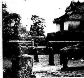
SÁT NẠCH MỘT THỊ XÃ THIÊU CHÂM SỐC

Đã phá hủy 1000 ga Đã phá hủy 1000 ga Đã phá hủy 1000 ga