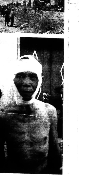
Không thể nào nói hết được, không thể nào diễn tả hết được những nỗi bi đát trên con đường này...