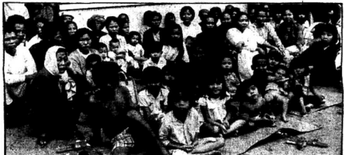
Phê phán việc rút quân của Mao Trạch Đông về phía Bắc Việt Nam.

BẮC KINH 23.11 (Tinhuông hay) 8.Kính đã đi chức một cuộc họp tại 40.000 người trước Đại sảnh quốc hội để hoan hô T. Trường BV Phạm văn Đồng. Người về Thủ TƯỚNG BK cũng đã được hội KT Mao Trạch Đông rất hoan nghênh.