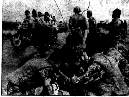
Cảnh chụp tại lễ nghi ở Nam Vang giương cờ tại Sài Gòn năm trước đây, bằng lễ nghi bỏ đoàn thể từ trên xe gắn máy phóng về, bên đường là cảnh quân VNCH đang sa sọt tiến quân.

FIGARO: MỸ ĐANG CÙNG CỖ VỊ THỂ MẠNH ĐỀ THƯƠNG THUYẾT CHIẾN TRANH BÙNG NỔ LỚN KHẮP LÃNH THỜ AI LAO-KPC