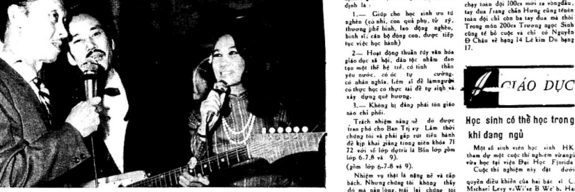
Ban Hợp ca Thăng Long đang say sưa tập dượt để chuẩn bị ở mùa 3 đêm Văn nghệ đặc biệt cứu trợ bão lụt Miền Trung.