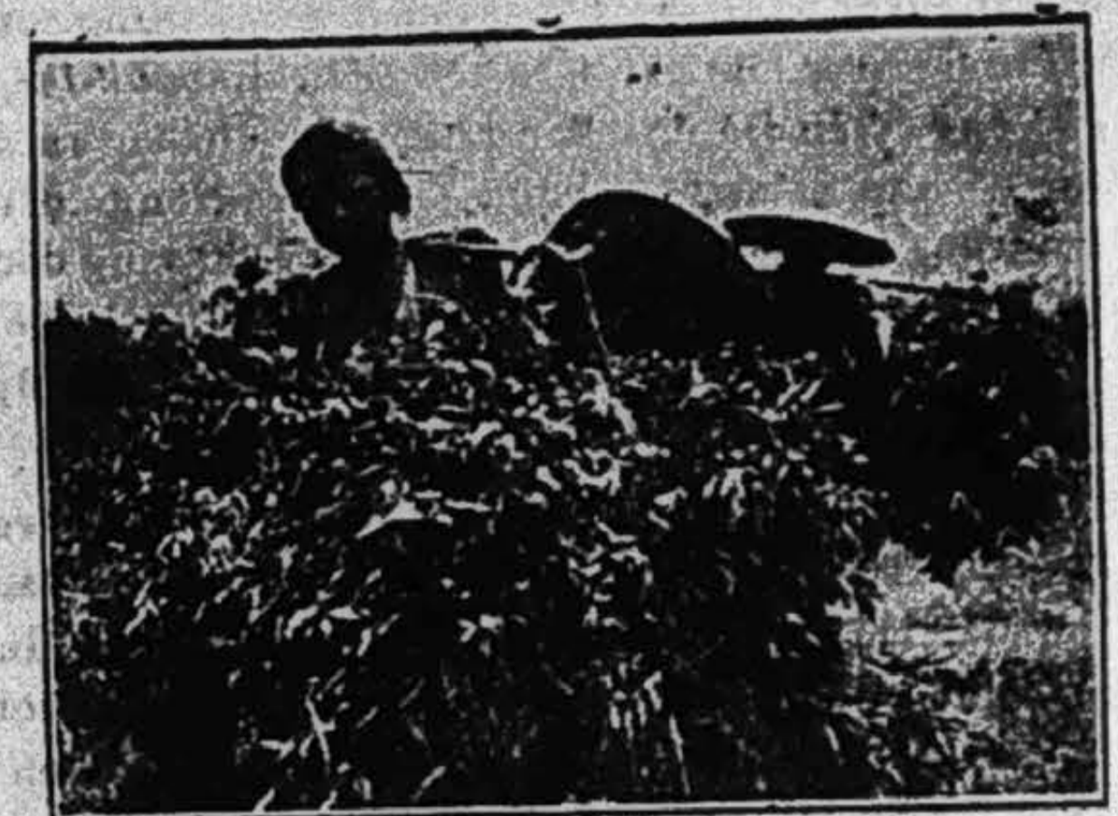
Một đoàn công-nhơn dân-bà hái lá tràm gánh về sử nấu lúc 12 giờ trưa.

lời g, nhất là khi ở trong hai chữ Khuynh-Diệp rất phổ-thông đó lại có ẩn-tàng một cái lịch-sử rất vẻ-vang mà hãy còn ít ai biết đến, khiến cho người hủu tâm với tí ực nghiệp không thể nào nhìn được mà đứng bều-dương ra, ngỡ hầu để khuyến-khích chung cho hết thấy ai ai có chí về thương-mại công-nghệ.