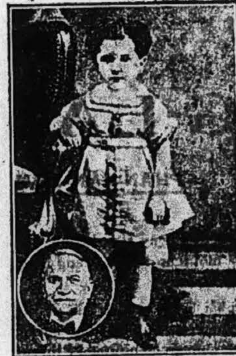
Nhi-dông là mãnh-lực của tương-lai.

Bởi vậy nên chỉ tôi dám khuyên với chị em, anh em trong nước hãy nên hết sức chú-y đến vấn đề này và mỗi người — vì tùy sức nấy — mỗi giúp giùm cho Tuần lễ nhi-dông được có thành tích cho rực rỡ.