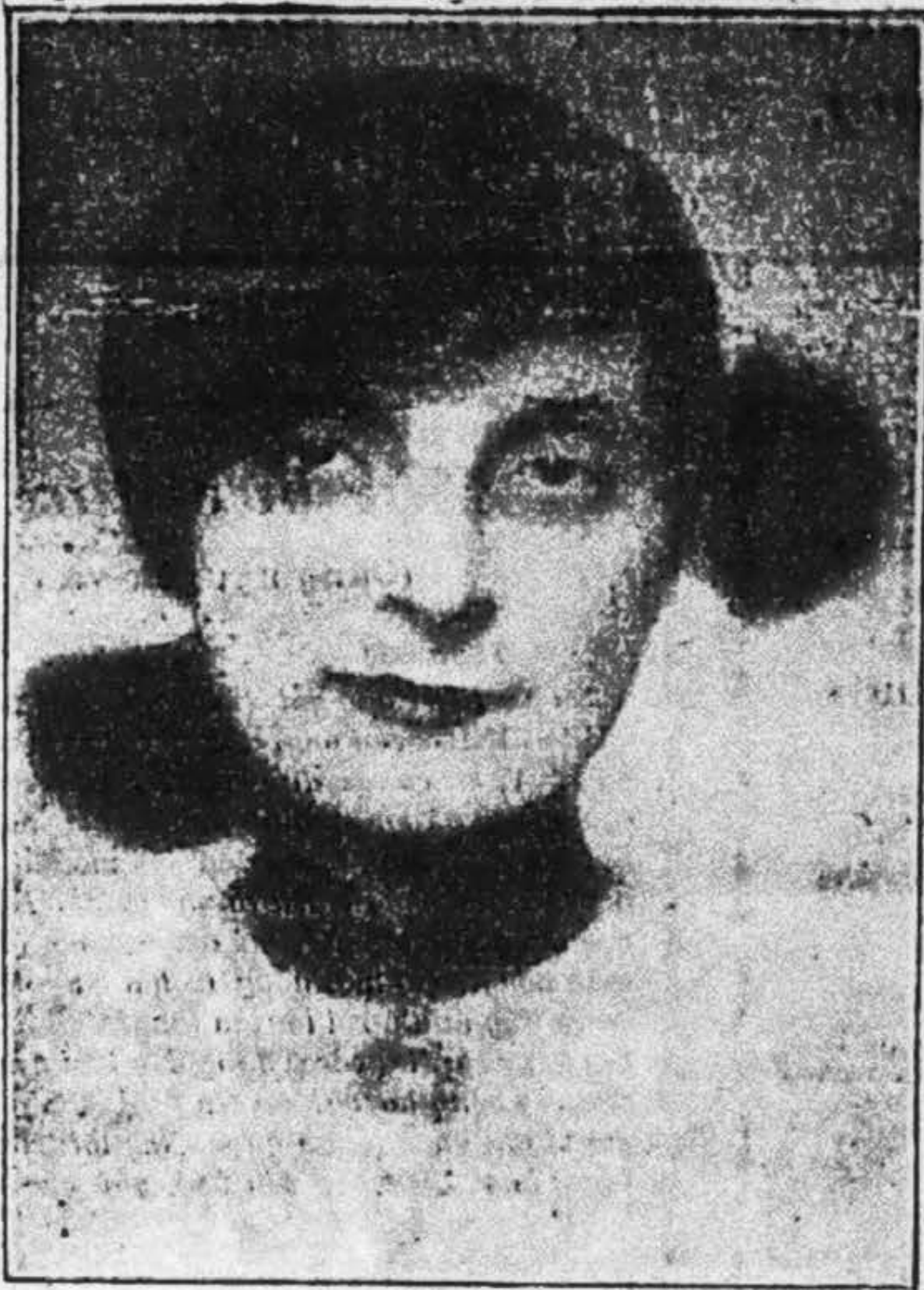
Bà Bá-Tước De Moailles nữ sĩ Pháp có danh tiếng lớn, mới tạ thế năm rồi.

== O$15 == NĂM THỨ SÁU ngày 4 Janvier 1934 == 230 ==