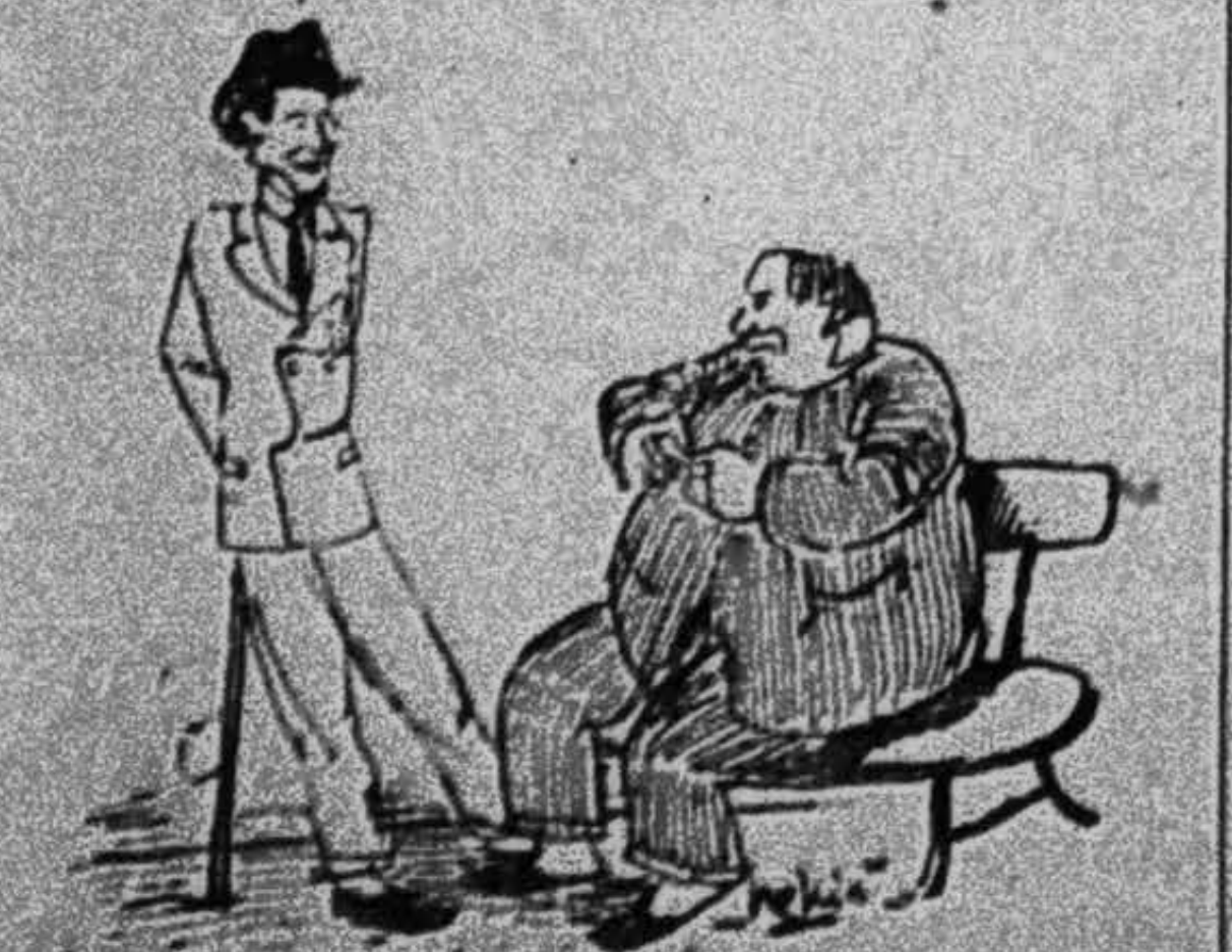
Ông tiên-sanh. - Sun lòng này anh không hút thuốc nữa... Ông tiên-sanh. - Đấy là quan Đổng-trư của tôi mời dân rằng, cần phải hoạt-dộng cho nó bớt phát-phát, nên chi bây giờ mời ông tôi đầu tiên thuốc lấy ma hút.

Một cái hồ nước đọng ở trên sườn núi ở tỉnh Cham-berry bên Pháp, thỉnh thoảng trôi đá ra, làm cho một vùng đất thật lớn, trên vùng đất có cây cối và đá hòn, chày chày xuống chon núi trầm ngọng ngon nước suối đương chảy mạnh. Trong khi đất lở eray như vậy, hồ có cồn, có nhà ở ở trước thời đều bị đá, đất làm cho hư sụp hết. Đất ấy chảy xa hơn hai ngàn thước mới hết trơn. Đường sá hư hai rất nhiều. Sự hư hao có 3 triệu quan tiền vậy.