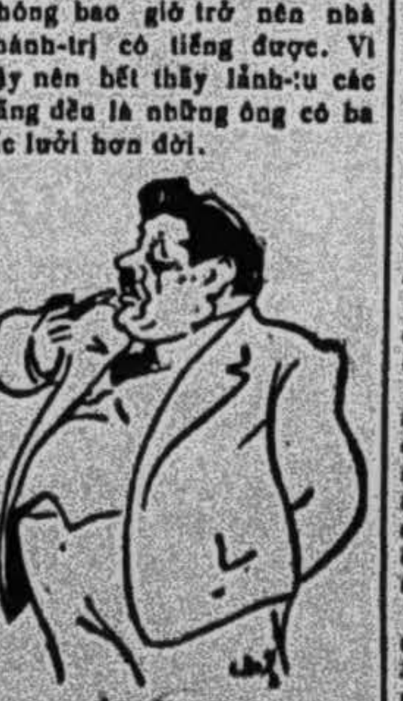
Ông Herriot Nước Pháp, trong các ông nổi tiếng về tài v khéo nói s ta nên kể ông Herriot. (Coi tiếp bên trong tu)

Cái tài hùng biện của ông HERRIOT Ở các nước theo chánh-thể đại-nghị, thì các nhà chánh-trị cần nhất phải nói giỏi. Điều người có tài cai-trị, có khiếu văn chương đến tới bực mà ngôn bất xuất khẩu thì cũng không bao giờ trở nên nhà chánh-trị có tiếng được. Vì vậy nên hết thấy lãnh-vu các đảng đều là những ông có ba tiếng lời hơn đời.