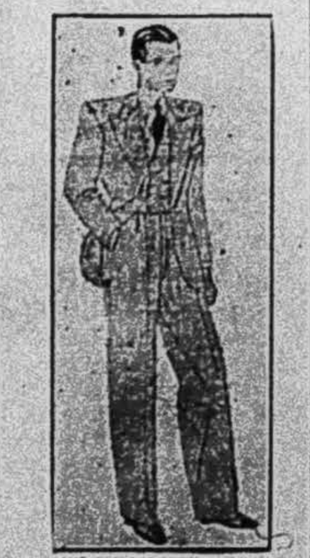
PHAN-BÁ-LƯƠNG 118, Rue Espagne, Saigon

May khéo, cái đúng, giá rẻ là mấy cái đặc tánh của tiệm: