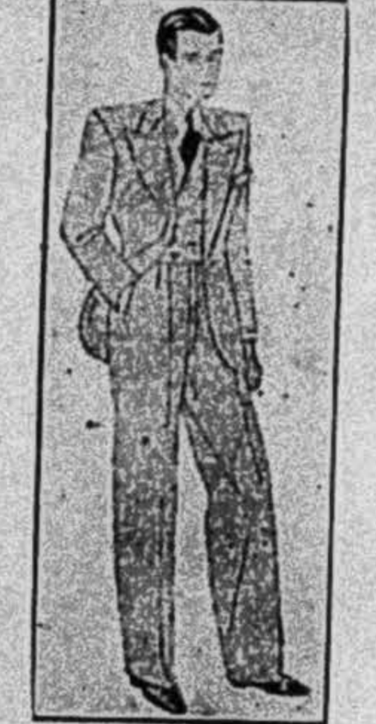
PHAN-BÁ-LƯƠNG 118, Rue Espagne, Saigon

May khéo, cắt đúng, giá rẻ là may cái dệt tánh của tiệm: