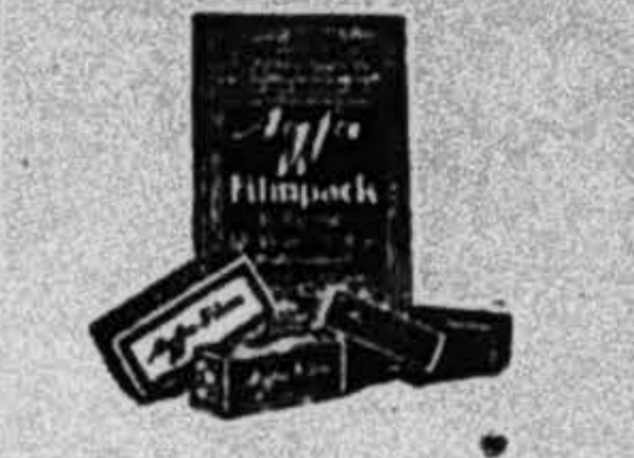
Tốt nhất trong hoàn cầu PHOTO KHANH-KY 44, B. Bonard, Saigon

Độc quyền ở Đông-dương hết thảy những món đồ chụp hình hiệu AGFA.