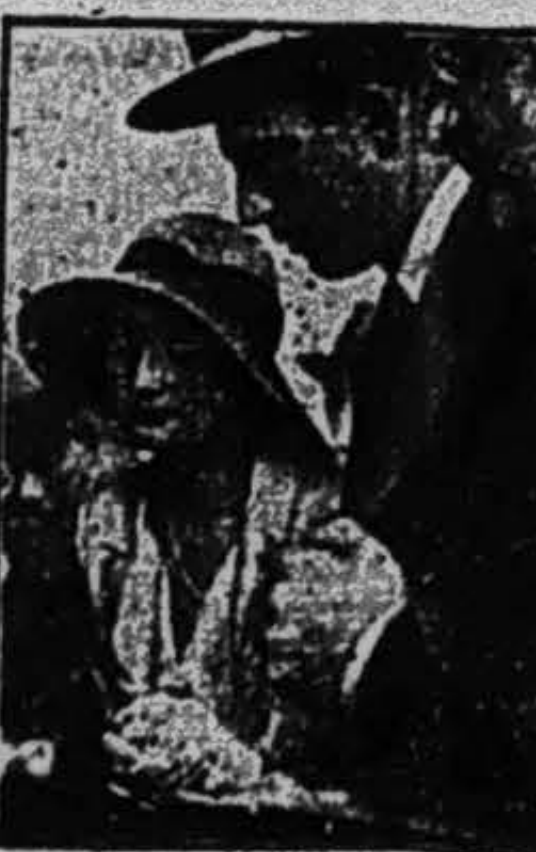
Hình vợ chồng Công-tước Brabant chụp lúc đến riêng Saigon

Ái là sao là sao của cô ở SaDEC. Hôm 10 Juin mới rồi có gánh hát Tân-Thịnh ghé lại tỉnh đó, các bà các cô bèn họp nhau tổ-chức một cuộc hát để lấy hươ-lợi giúp cho đản-bà bị bão lụt ở miền Nam-Trung-kỳ.