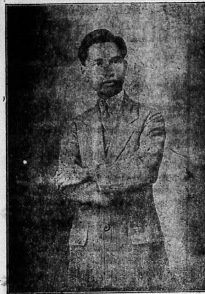
Chôn-hon, ĐO-KHAI-QUANG cần khải.

Tiền chụp hình VA TRÔNG RĂNG HIỆU ĐẠI-ĐÔNG