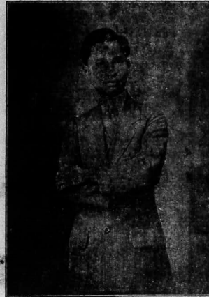
Chủ nh'ôn, Đ'Ô-KH'AI-QUANG c'ân kh'ôn.

Có một mình hàng Denis Frères số 17 phố nhà thời.