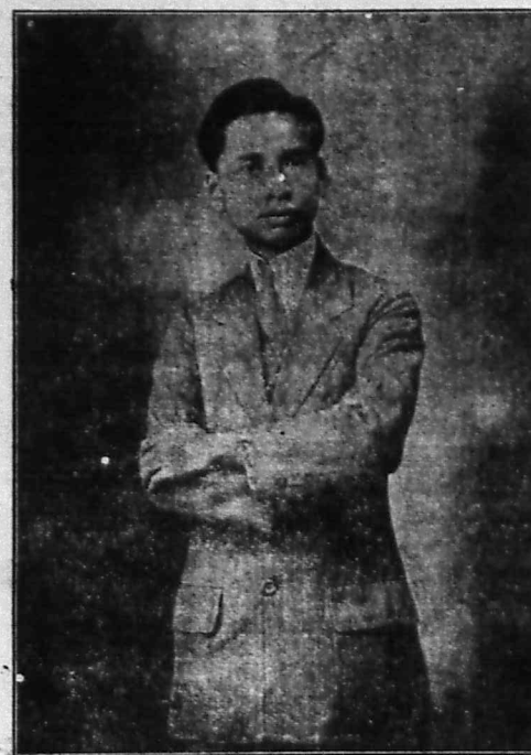
Chủ nhơn, ĐO-KHAI-QUANG cân khải.