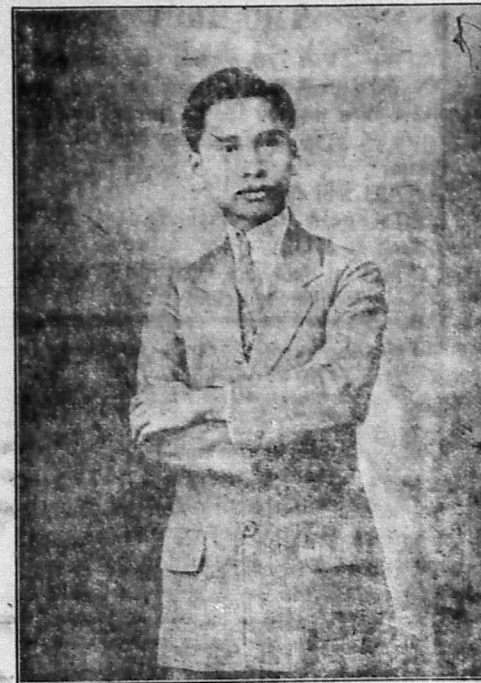
Chủ nhơn, ĐO-KHÁI-QUANG cân khải.

KUYY BUN ROYAL MELCHIOR Phân Vàng, Tinh Mui, Phân Trắng, Phân Xanh, Rượu Langsa, Phân Đen LHOMAGHOT HUYEN-DE-SOBO đường Pellerin Saigon.