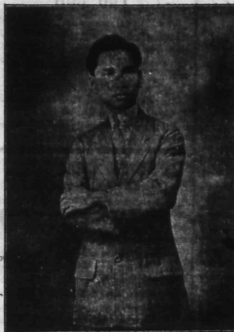
Chủ nhơn, ĐO-KHAI-QUANG cân khải.