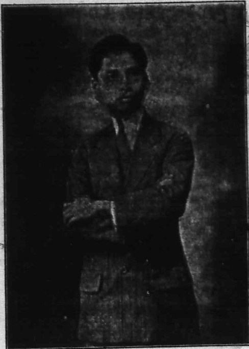
Chủ nhơn, ĐO-KHAI-QUANG cân khải.