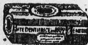
PÂTE OU SAVON DENTIFRICE