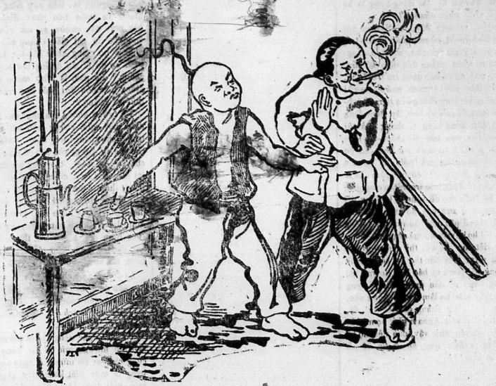
Thôi mà! Tao có phải như mấy thằng đầu trâu mặt ngựa hay sao mà mời tao vô đó nữa!!

Tôi hát thuộc thì tôi cử đồng giấy hiệu Le Nil mà thôi.