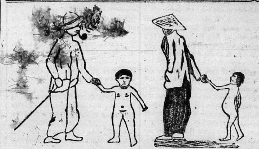
— Ừa chào anh, vậy chớ anh dắt cháu đi đâu vậy? Hứa mền ói! Mà sao, cái bụng nó bị h rình vậy anh?

Chừa mình lên sân tàu chơi rồi, thì phòng trống, người dọn phòng cứ vào phòng quét dọn, xếp mền sắp giường lại. Khăn lau mặt mỗi ngày mỗi thay, còn bao gối, bao nệm (drap de lit) một tuần thay hai kỳ. Nước rửa mặt, thì nước ngọt. Không có đờ xà-bông thơm, mình phải mua lấy mà đưng. Dưới tàu có người hút tóc bôn đủ xà-bông thơm, dầu thơm, dầu chải răng, bàn chải răng và nhiều món khác nữa.