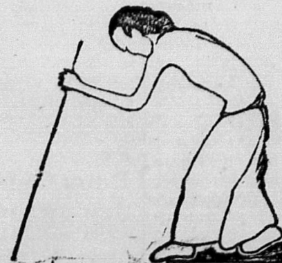
Tôi cũng vì ham vui mà mang lây bịnh độc rất hiểm nghèo, nay tôi nghe đón tại tiệm Nhị-thiên-Đường ở Chợ-lớn có một thứ thuốc Suru-độc-linh-được hay lắm; nên tôi phải rãng lãn hỏi đến đó mua mà uống chớ mau lành bịnh, chớ biết sao bây giờ.