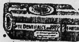
PÂTE OU SAVON DENTIFRICE