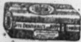
PÂTE OU SAVON DENTIFRICE