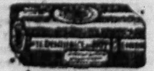
PÂTE OU SAVON DENTIFRICE