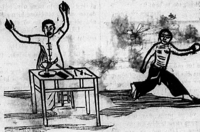
(1) Hô! Cái lấy chum là ấn-cứp-cạn lừa la!!

Có một người Khách-trú kia làm thợ bạc rất khéo. Bữa nọ đang ngồi mà chạm một cây kiền vàng, sáng có cái đèn để hàn hồ trước mặt anh ta đó. Bỗng đâu lại có một người lạ mặt ở ngoài đi cà nhót bước vào, mặt mày nhàn nhố, tay cầm một miếng thuốc dán rất to, và đi và rên, bước lần đến trước mặt chủ thợ mà nói rằng: « Tôi bị một mụn nhọt nơi dưới háp chơn lớn quá, nay nó đon mủ đau đớn khó chịu, mà miếng thuốc dán này thì khô queo, dán nó không dính, cứ rớt hoài, không dám nào, xin chú làm ơn cho tôi hờ nhờ một chút. » Anh thợ cũng vui lòng, liền chỉ cái đèn mà nói rằng: « Lên ló! anh hờ hết gì thì hờ ló. » Thuáng nọ đem hồ cầm ơn. Bèn kê miếng thuốc dán ngay trên ngọn đèn mà hờ cho chảy, rồi xuất kỳ bất ý vả chặt miếng thuốc dán ngay miệng anh thợ một cái rất mạnh, giựt tuốc cây kiền cong lưng chạy mất. Thợ ta muốn là ma-là, mà bị miếng thuốc dán bít miệng bít mõm, há miệng không ra mà la cho được. Đến khi gỡ được miếng thuốc dán ra rồi, thì kiền và người đã đào chi yêu yêu, bắt tri khứ hương. Ô hô! Thuốc dán cũng là một vật hại to lắm chớ phải chơi gi!!!