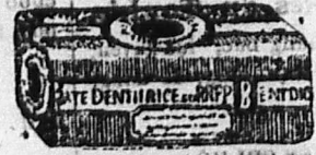
PÂTE OU SAVON DENTIFRICE