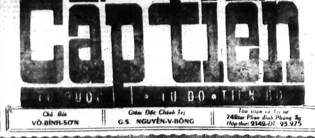
Chiến Địch Chính Trị G.S. NGUYỄN-V. BÔNG

SAIGON (V) 15.8. - Tin từ thành phố Vinh, lúc 8 giờ sáng 15.8. Báo Nhân Dân đưa tin bão Hoàng Sa đang hoành hành ở vùng biển Đông Bắc với sức gió lên đến 185 cây số. Được biết vào 10h30 ngày 14.8 tại Vinh, ảnh hưởng Việt Nam đã phát giác bão này cách đơn Lũng ở phía Bắc Hải Phòng chừng 350 cây số về phía Tây. Hiện bão đang di chuyển hướng Tây hoặc Tây Bắc và có thể cách Hải Phòng chừng 120 cây số về phía Đông Bắc vào 8 giờ sáng ngày 16.8. Bão di chuyển trên biển Bắc và trên 17 và có thể