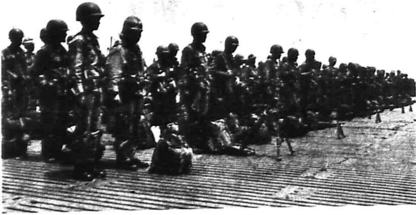
Các chiến sĩ anh hùng của SD23BB túc trực tại sân trực thăng chờ lệnh tiến quân