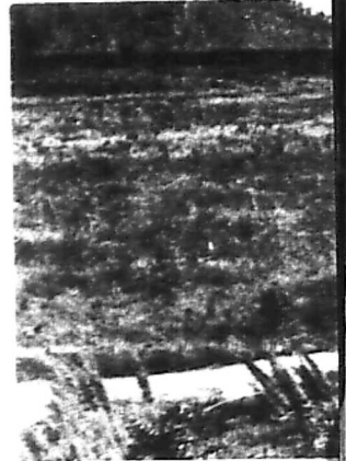
Thiếu Tướng Tư-Lệnh QK II + QĐ 2 ra sân trực thăng để đưa những chỉ thị cần thiết.