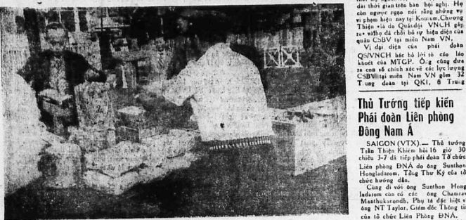
Bách Phiến và Á phiến bị tịch thu đang được mang ra để thiêu hủy vào sáng 4-7-73 tại đường Duy Tân Saigon.

SAIGON (NBH) — Phía hợp tác Tướng Văn Tiến Dũng (VTD) hôm nay 3-7-1973 đã ký một bản cam kết của CSBV về tránh né thảo luận về phía quân đội VNCH. Ông nói rằng phía quân đội VNCH đã từ chối thảo luận về những điều kiện mà phía quân đội VNCH đề ra.