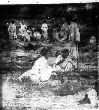
Ở đứ có Cộng Sản reo rác chiến tranh, nhưng thường dân vô tội cũng bị sát hại không khác gì người.