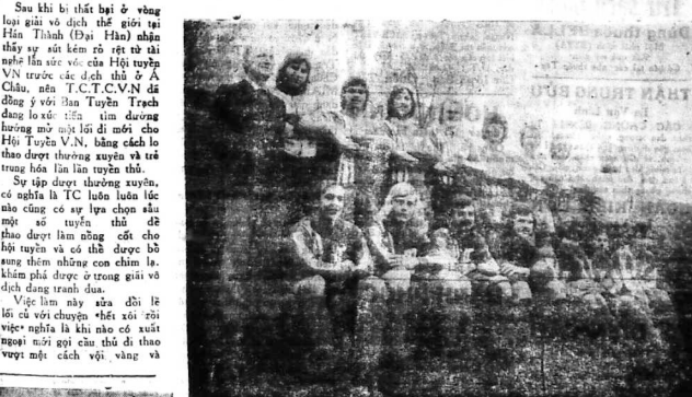
Đội cầu HERTHA (Tây Đức) sẽ sang VN đấu đêm 11-7-78