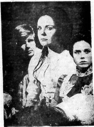
5 khuôn mặt sẽ làm khán giả điếc bịt chủ ý trong phim LA RESIDENCE

5 phút trước khi đèn bật sáng, khán giả mới biết rõ ai là thủ phạm. Sự khám phá đó đã làm tất cả những người xem nhai sừng sò!