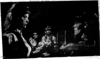
Nhiều khuôn mặt con gái đó kêu đã xuất hiện trong phim LA RESIDENCE làm khán giả phật... thờ đức

MỘT chuyện hương mới đi đến với nhạc Trẻ Việt Nam. Nhiều lý do khác biệt đã đòi hỏi 1 say thay đổi chiều hướng trình diễn một số ca sĩ và ban nhạc trẻ. Đó đến lúc nhận thức rằng việc chuyên trình bày những nhạc phẩm lý ngoại quốc đã không còn thích hợp như trước. — MỘT NGÀY XA EM (Never my love) — RỒI TÌNH YÊU SẼ ĐÉN (Too Young) — MƯA ĐÔNG EM ĐI (?) — TIỀN EM LẦN CUỐI (Five hundred miles) — KIẾP PHIÊU BÔNG (Unchained Melody) — TÌNH YÊU MƠ KHUẤT (Love Is Blue) — NHƯ MỘT GIÁC MƠ (Release Me) — RỒI MÀ ĐÁY (Love Mancho To Quiero) — THƯƠNG NHỚ TRONG MƯA (The end of the world) — TÌNH YÊU VỚI CẢNH (EI London Pass) — ĐẸM ĐEN (La Nuit) — YÊU NHAI ĐU (Besame Mucho) — TÌNH BÙN ĐẸM MƯA (The Rhythm of Rain) (Xem tiếp trang 6)