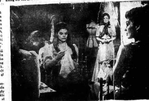
Cảnh mà nhiều khán giả sẽ ghi nhớ nhất trong phim LA RESIDENCE, vì những sound-effect độc đáo v.v.. ở căn của nó!

CÂU CHUYỆN xảy ra tại miền Nam nước Pháp, trong 1 trường trung học chuyển cảnh hóa những thiếu nữ, vào đầu thế kỷ 20. Ngồi trường đó là Fournes, một giáo phụ khắt khe điều khiển. Bà ta có một đứa con trai 15 tuổi, tâm tính rất phức tạp, cảm thông sống với bà. Bà Fournes tìm đủ mọi cách để cậu con trai sống thật với các cô gái mới trẻ, nhưng cậu thừa hiểu rằng đây là tìm cách để gặp họ. Bà mẹ bắt được cậu tang và sau khi la mắng đã bắt cậu con mà không bao giờ gặp các cô nữa. Có nhiều thiếu nữ đã bỏ trốn khỏi trường, bà Fournes bèn cho khóa tất cả các cửa lớn và đóng đinh tất cả các cửa sổ. Những tuần lễ trôi qua, nghe ai vì ông về nhà, nhưng như cơm cục l. Nhưng khi xem xong phim, khán giả sẽ thấy mình bị đạo diễn đánh lừa, hay đúng hơn đánh lừa hướng sự luận, và mãi 5 phút trước khi đèn bật sáng, người