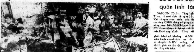
SAIGON 25-5. Theo hình ảnh của một đơn vị quân đội VNCH đang di chuyển qua một vùng đất trống.

TY QUẢN LÝ VÀ TH. S. 140, Le Lai Saigon 2 - D.T. 196034