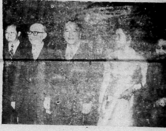
Phó Tổng-Thống THQ Nguyễn Văn Thiệu và Phó Thủ Tướng VNCH Nguyễn Văn Thiệu đang nói chuyện với các quan chức của VNCH tại Thủ Đức, Thành Phố Hồ Chí Minh.

Chuyên Công du «Hợp tác trong Hòa Bình» của Tổng Thống Việt Nam Cộng Hòa Thành công là bước trưởng thành «gần gũi» nhất mới ý đồ xam lăng của Cộng Sản.