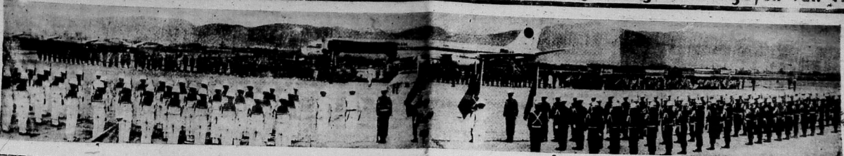
SEP 1 1973 UNIVERSITY LIBRARY