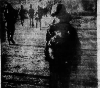
Thần hiệp ngưng bắn đã có hiệu lực gần 30 ngày, nhưng vì Cộng quân vẫn tiếp tục phạm trọng một số hành động vi phạm hiệp định ngưng bắn, nên việc ngưng bắn vẫn chưa được thực hiện hoàn toàn. (Ảnh S45)

Gần tới lúc ngưng bắn Cộng quân đánh lại Kampuchea NAM VANG 26/2 (UPI). Các quan chức của Việt Nam Cộng Hòa đang cố gắng để ngưng bắn với Cộng quân ở Kampuchea.