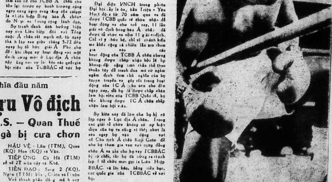
Thần Oll! Thần Oll! ngay lập tức cơn bão. Joe Frazier đương kim vô địch thế giới đã đánh bại George Foreman đương kim vô địch thế giới.

Tại thành phố Jakarta năm 1963 thì cũng một phần của VN. Sau khi đánh Joe Frazier ngay xung quanh G. Foreman được lệnh trọng tài phải lui về góc mình để nghỉ.