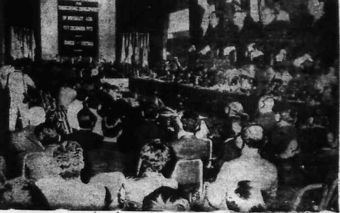
Hội họp sáng ngày 11-12-72. PIT Trần Văn Hương đã đến chủ tọa hội nghị cấp Tổng Tịch (ĐP) ANH TRƯ (Góc) PIT Trần Văn Hương, Thủ tướng và Thủ Vi Chỉ tịch Thượng Council University-Sector tại Quảng Cảnh Hội Nghị Cấp Tổng Trưởng đã tham dự.