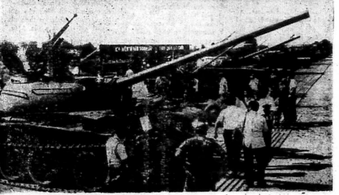
Sáng ngày 7-12-72, Phái Đoàn B, C và VN và Ngoại Quốc đã được mệnh danh là Địch xâm chiếm lại phần của TQLC tịch thu của CSVN tại một trận đánh tại và sẽ trong bảy tuần lam cam đặc trưng của vùng này từ 12/72 trở đi.

MỘT BẮC SĨ TQLC KÈ LẠI TRẬN ĐÁNH CHIÊM CỐ THÀNH QG-TRỊ Nhiều Thương binh TQLC