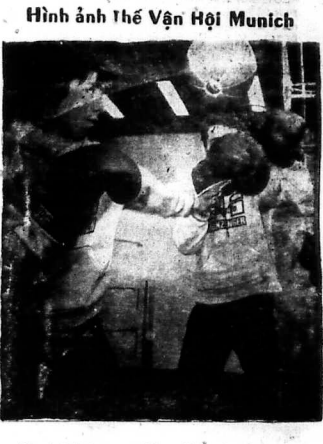
Hình ảnh Thế Vận Hội Munich