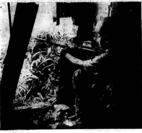
Người chiến sĩ trở của Sư đoàn 18 Bộ Binh vẫn luôn giữ vững tay súng mỗi khi tiến sâu vào vùng đất bị tái chiếm trong tay địch.

* Sáng Chủ nhật, chiến sĩ ta đánh tan cuộc tấn công của CSBV có chiến xa yểm trợ tại Tiên Phước. 1 chiến sĩ ta bị bắn cháy * BBQ vấp chặt Công quân ở Kiên Lương, hạ 34 tên, tịch thu nhiều súng lớn hơn.