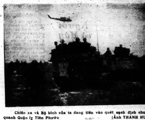
Chiến xa và Bộ binh của ta đang tiến vào quét sạch địch chung quanh Quận lỵ Tiên Phước

chúng nằm lộn xộn hàng dọc... (Continuation of the military report from Quang Tri)