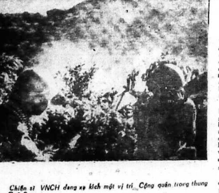
Chiến xa VNCH đang va chạm với vị trí Cộng quân trong thung lũng Quê Sơn

Các cuộc tiếp xúc của Kissinger & Mạc tư Khoa được mô tả là bí mật, không hề nào tiết lộ những đề tài mang ra thảo luận