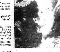
Xem tiếp trang 8 B

MẬT TRẦN TÂY NAM HƯNG LÊ DIU BĐQ cận chiến với CSBV tại Tiên Phước có 108 tên tởm thu 3 B.40, 1 súng cối 60 ly và 10AK47