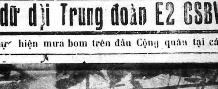
DPQ-NQ.Thiên quyết giờ vờng đồng bằng... Đỉnh Trường, Thiên quyết giờ vờng đồng bằng...

Trong khi nhiều phi tuần B52 thực hiện mưa bom trên đầu Cộng quân tại các vùng chúng ẩn trú, làm rung chuyển cả nhà cửa ở Đỉnh Trường và Bến Tre