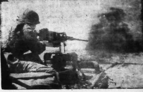
Xem tiếp trang 8